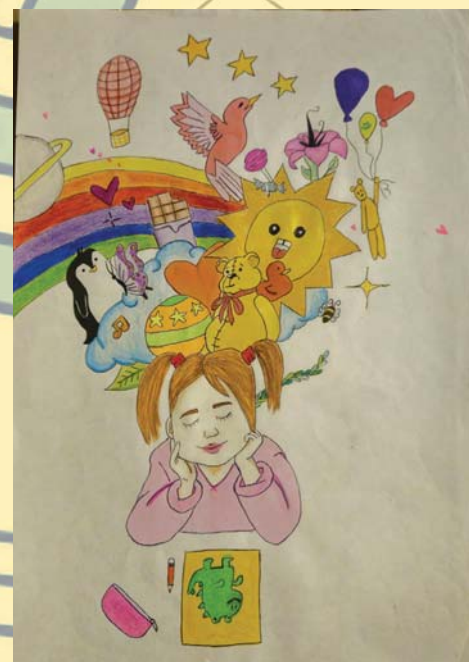
Стефана Стаменковић 8/1