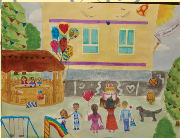
Даница Митровић 6/3