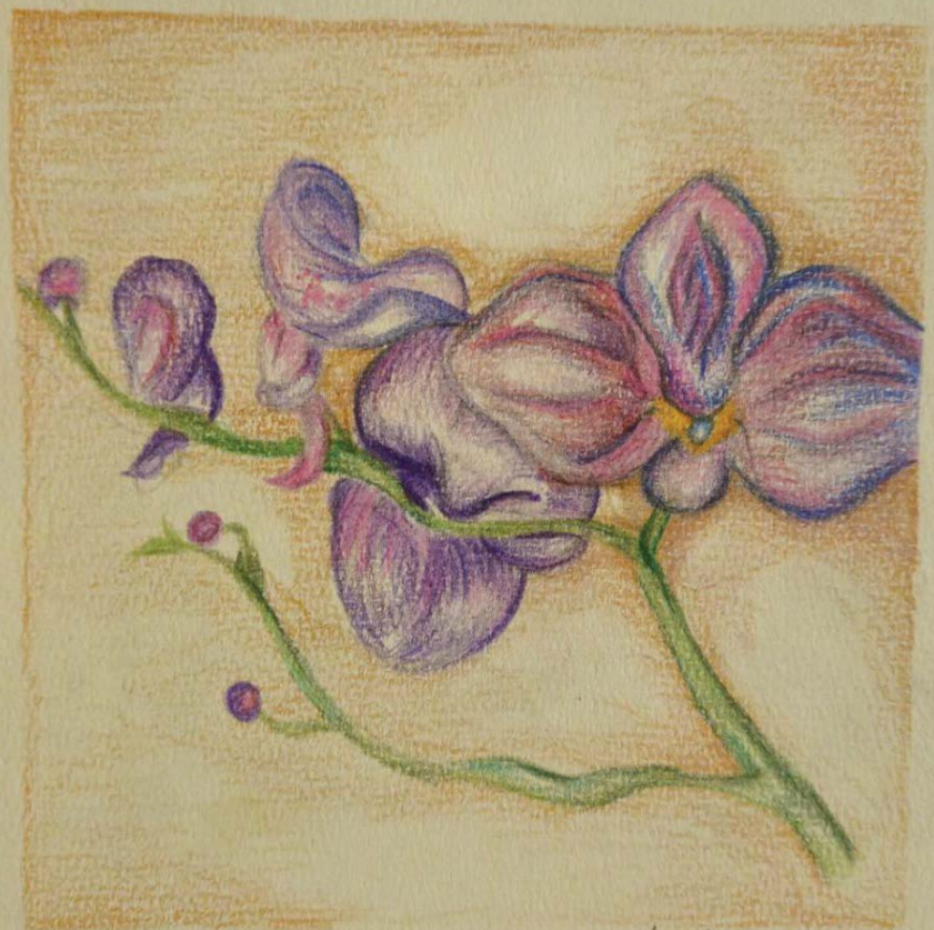
Лена Младеновић 8/4