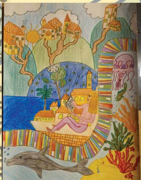
Јана Јовић 5/2