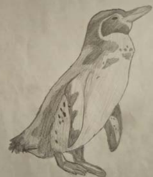
Мина Павловић, 8/1