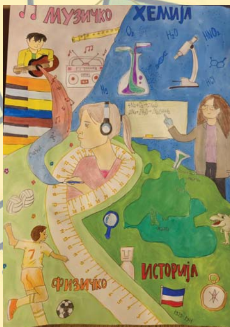
Стефана Стаменковић 8/1