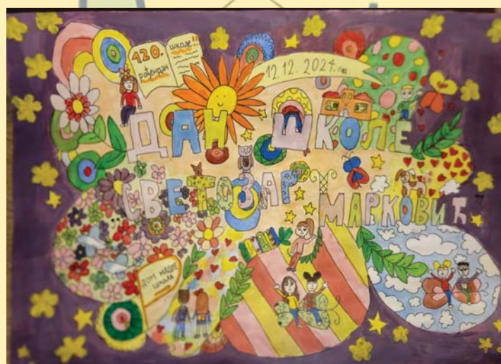
Катарина Тодоровић 6/1, 2. награда на конкурс