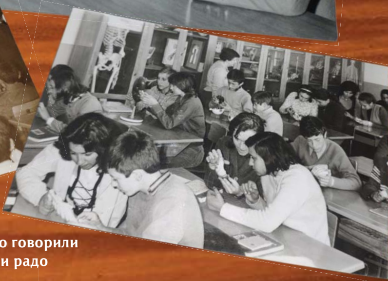
Стихове смо говорили наглас и радо