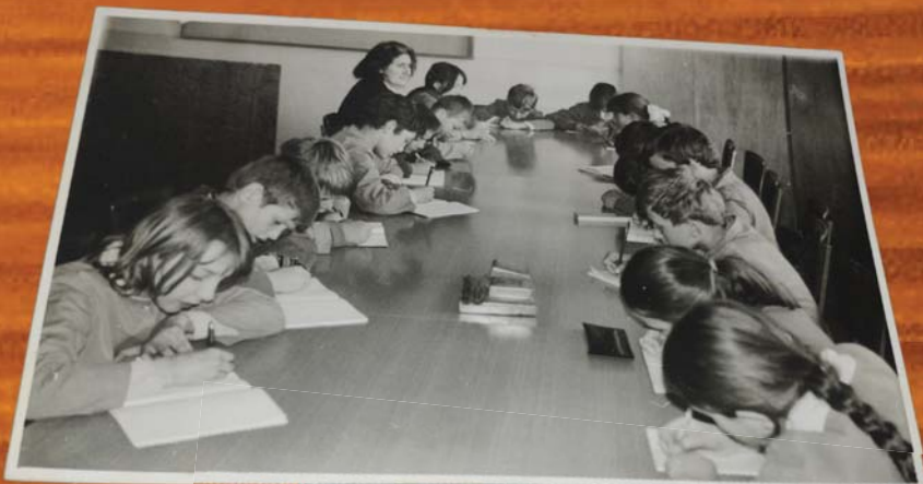
Некадашње уређење часописа „Пчелице” изгледало је овако