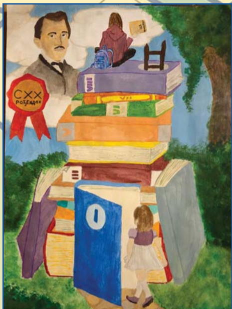
Мина Павловић, 8/1