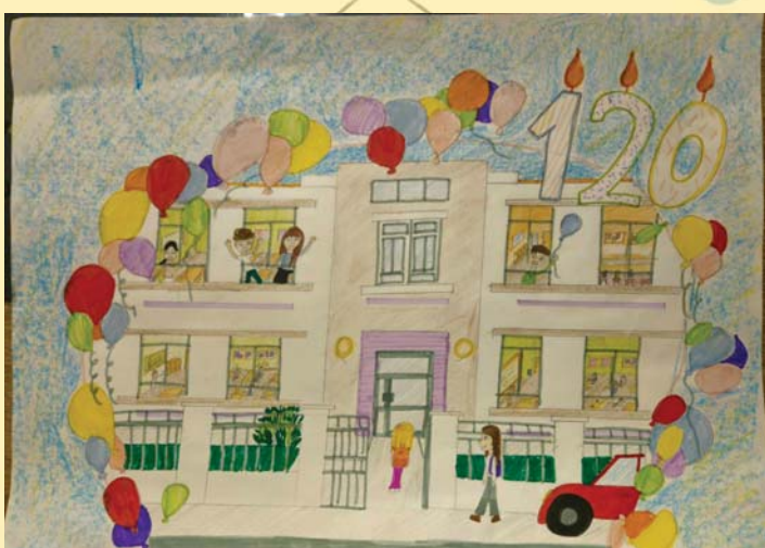
Ива Станимировић 8/1