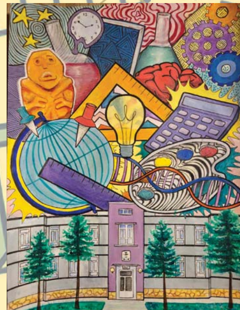
Милица Жунић 7/4, 1. награда на конкурсy