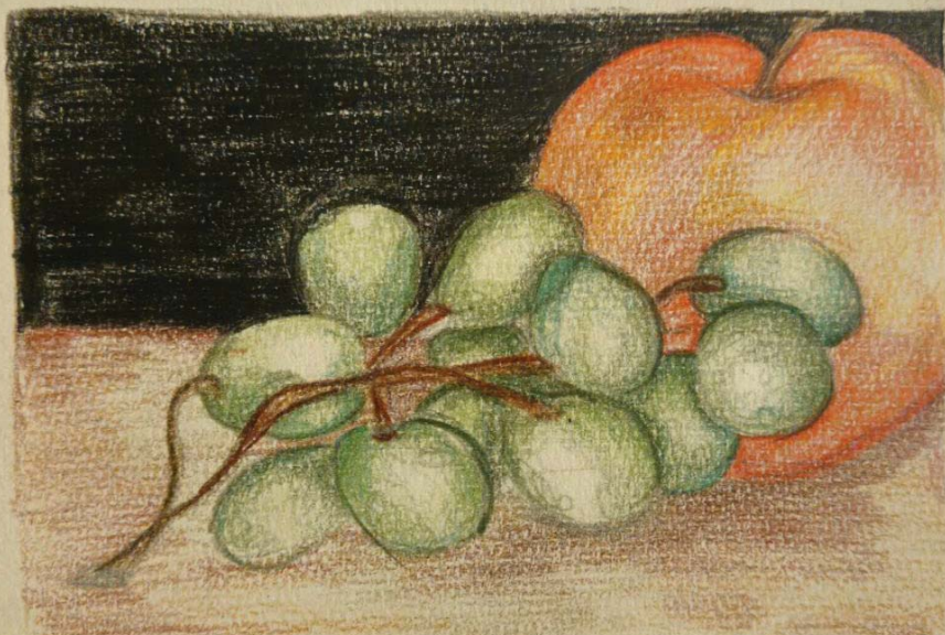
Лена Младеновић 8/4