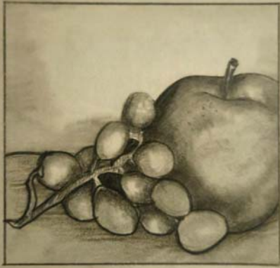
Лена Младеновић 8/4

„Направила сам на- питак од кога је чар- обњак постао добар и ослободио се отрова који му је вилењак дао.”