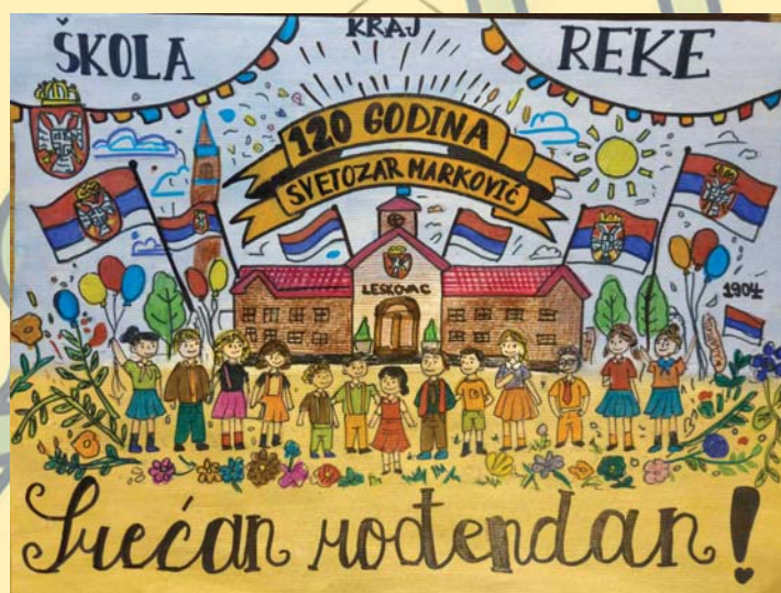
Петра Ристић 8/1, 3. награда на конкурс