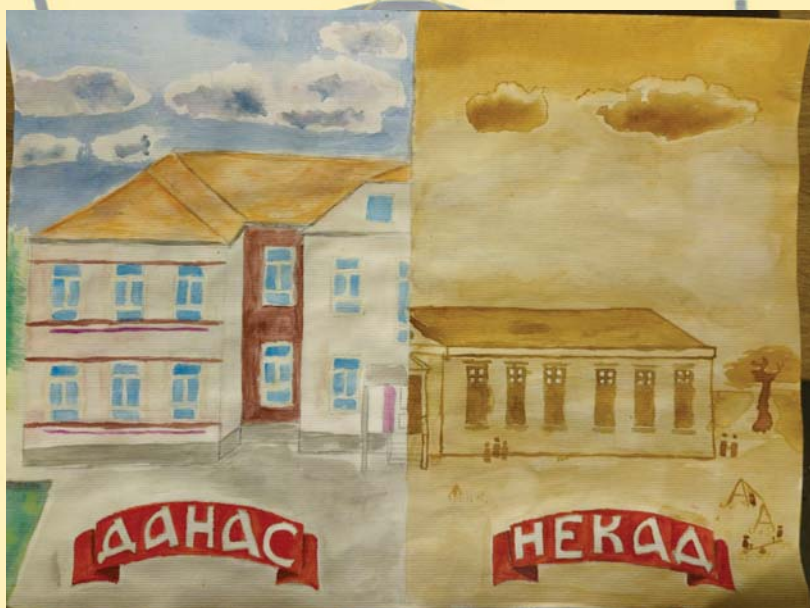
Кристијан Младеновић 8/1, 3. награда на конкурс